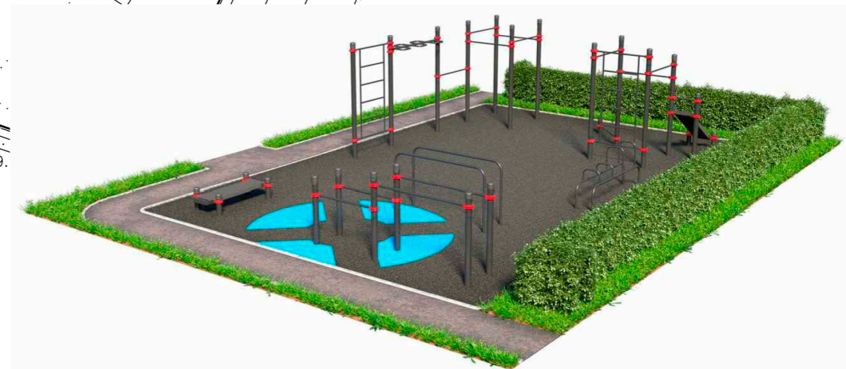
Воркаут-зона. Размер 8м x 12м