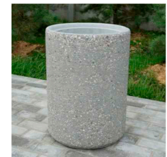
Бетонная урна. Объем 45л. Высота 620мм