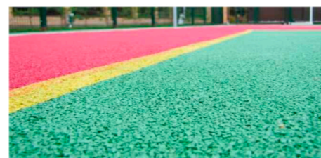
Бесшовное резиновое покрытие TORUDA Eco Sport Standart