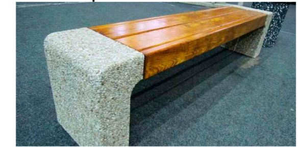
Скамья "Венди". Размер 1,9x04x04м