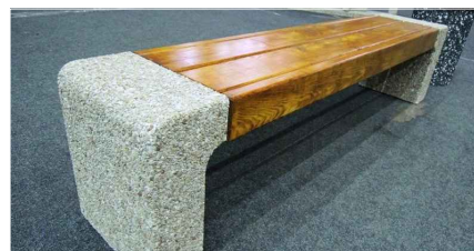
Скамья "Венди". Размер 1,9x04x04