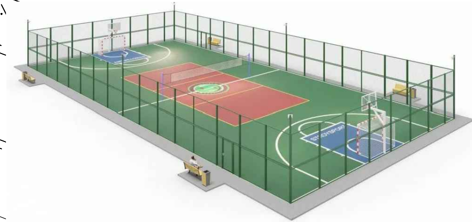
Спортивная универсальная площадка. Размер 17x30м