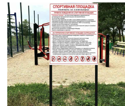
Доска объявлений 910x40x1900мм