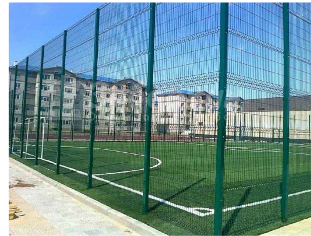
3D ограждение спортплощадки L=94м