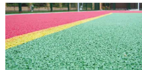
Бесшовное резиновое покрытие TORUDA Eco Sport Standart