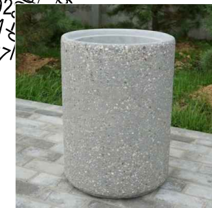
Бетонная урна Объем 45л. Высота 620мм