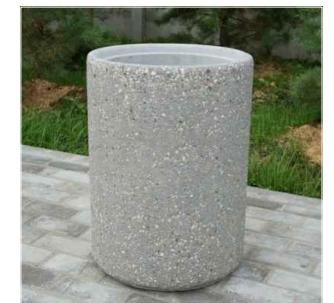
Бетонная урна. Объем 45л. Высота 620мм