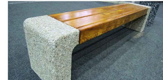
Скамья "Венди". Размер 1,9x04x04м