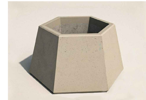
Вазон. Высота 450мм. Вес 220кг