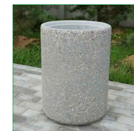
Бетонная урна Объем 45л. Высота 620мм