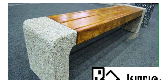
Скамья "Венди". Размер 1,